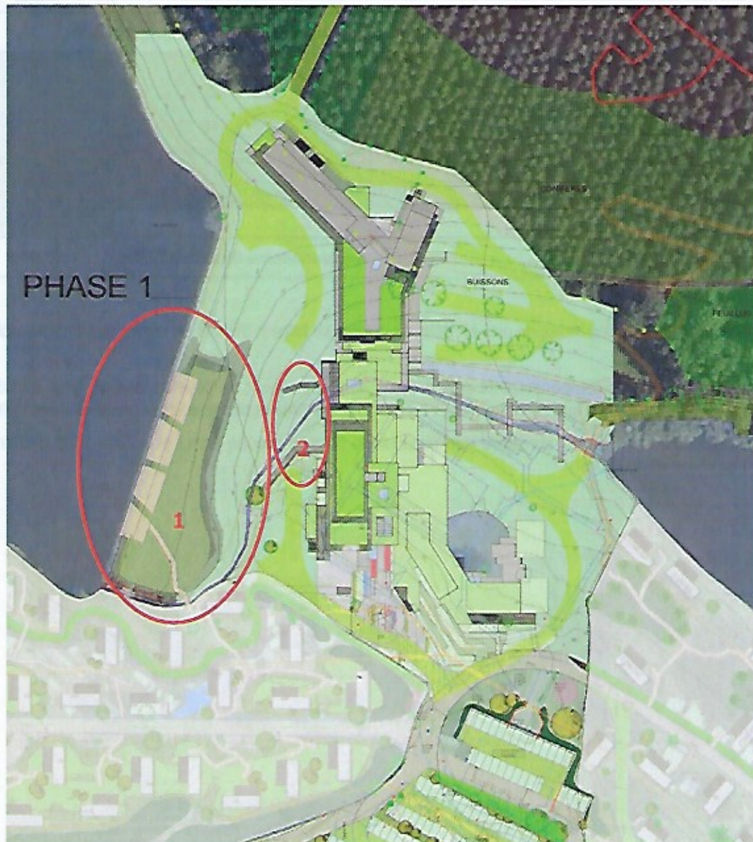
Fig.5: Vue d'ensemble du complexe hôtelier projeté (version provisoire)

La figure 5 montre l'état actuel de la planification du complexe hôtelier et de ses environs. D'après les déclarations du groupe Lamy (28.04.2020), les zones entourées en rouge sont, selon l'état actuel de la planification, des zones gazonnées et il n'y aura pas d'aménagements.