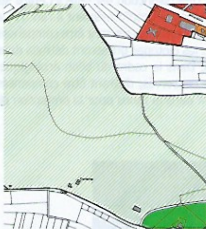
Fig.2: Extrait du PAG