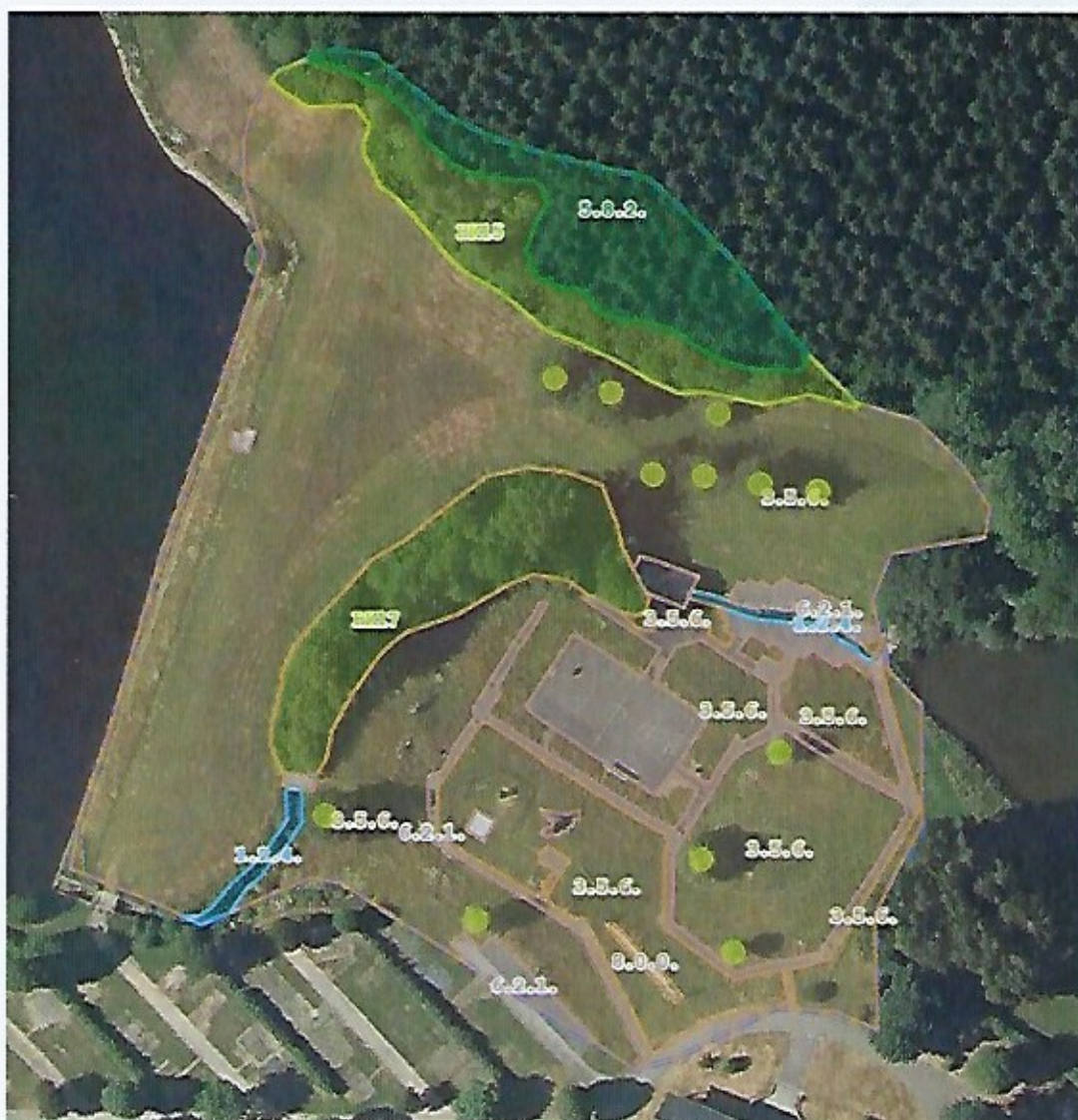
Fig.4: Situation initiale de la zone du complexe hôtelier sur le „Site touristique de Weiswampach”